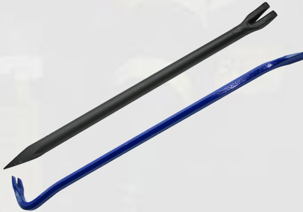
Brechstange / Nageleisen